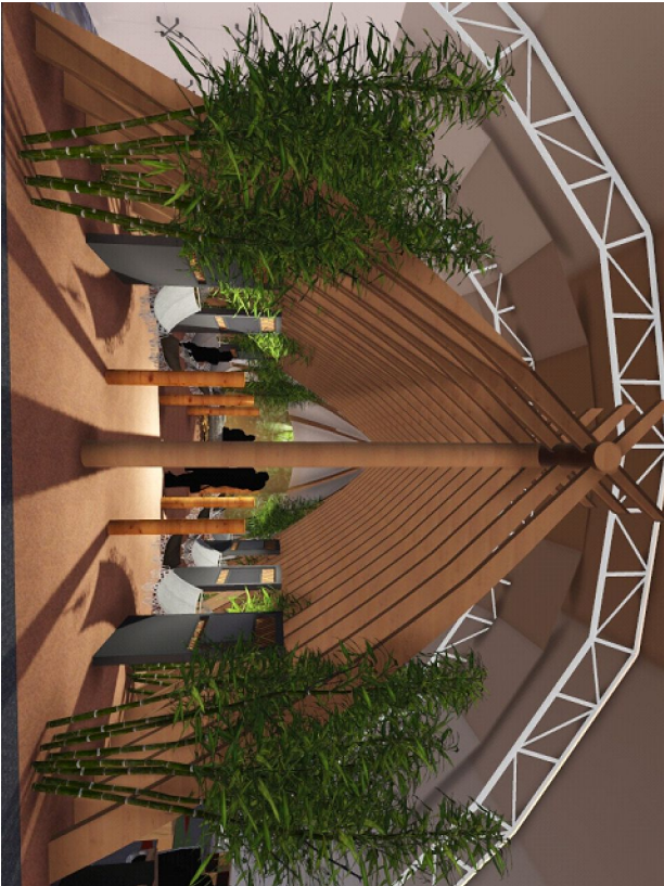
3 D - SETOR 6

OBSERVAÇÃO: Todas as medidas deverão ser confirmadas e conteúdos in loco pelo executor